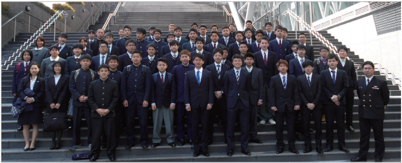
佐世保市・県北地区・松浦地区