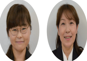
上村期間業務隊員 北岡期間業務隊員